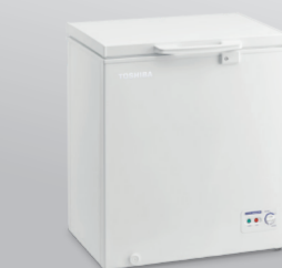
CR-A142 (5 ฟุต)