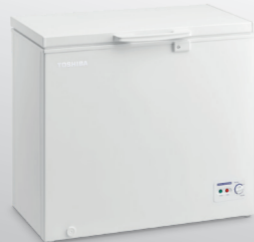
CR-A198 (7 ฟุต)