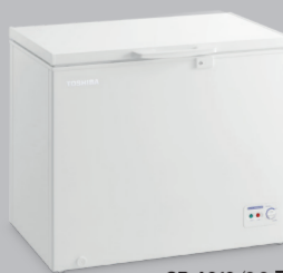
CR-A249 (8.8 ฟุต)