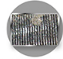
แผงคอยล์ที่ไม่ถูกเคลือบ ด้วยสาร Aqua Resin