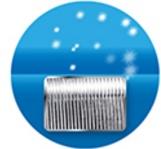
แผงคอยล์ที่ถูกเคลือบ ด้วยสาร Aqua Resin