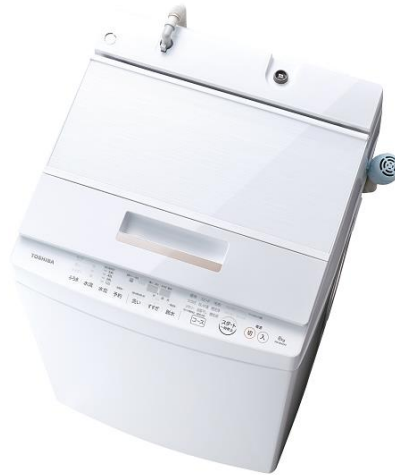
(W)グランホワイト AW-8D6 AW-7D6

東芝ライフスタイル株式会社は、全自動洗濯機の新製品として、「メガシャワー」と「ザブーン水流」を組み合わせで汚れを落とす「浸透ザブーン洗浄」を搭載した「ZABOON(ザブーン)」AW-8D6(洗濯容量8kg)、AW-7D6(洗濯容量7kg)を5月26日から発売します。