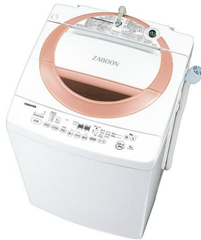
(P)シャイニーピンク AW-D836

ほかに、「浸透ザブーン洗浄」を搭載した全自動洗濯機「ZABOON(ザブーン)」AW-D836 (洗濯容量 8 kg)を5月26日から発売します。