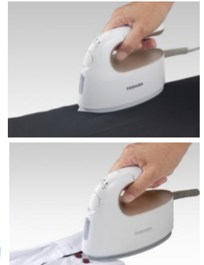
アイロン機能イメージ