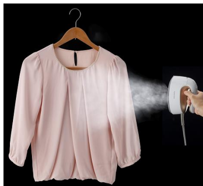
使用イメージ(シワのケア)