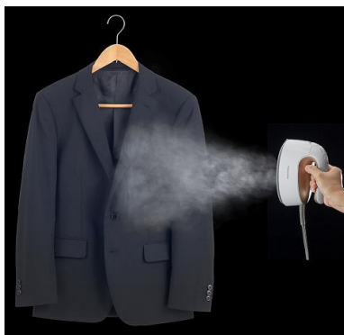
使用イメージ(ニオイのケア)