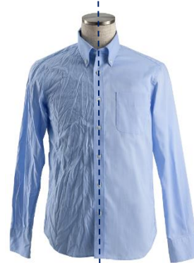
使用前後イメージ