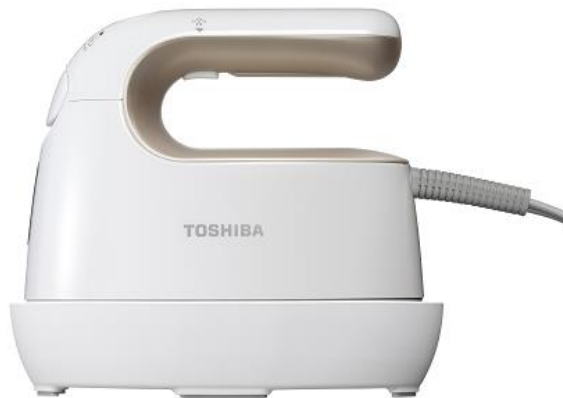
(NW)ゴールドホワイト

東芝ライフスタイル株式会社は、衣類のシワの深さやニオイの強さによって選べる2段階のスチーム量設定で、最大約15ml/分のパワフルな連続スチームも可能で厚手の衣類にも浸透しやすく、ハンガーにかけたまま素早く・簡単に衣類をケアする、便利なアイロン機能も備えた1台2役の衣類スチーマー「TAS-X3」を2色展開で11月末から発売します。