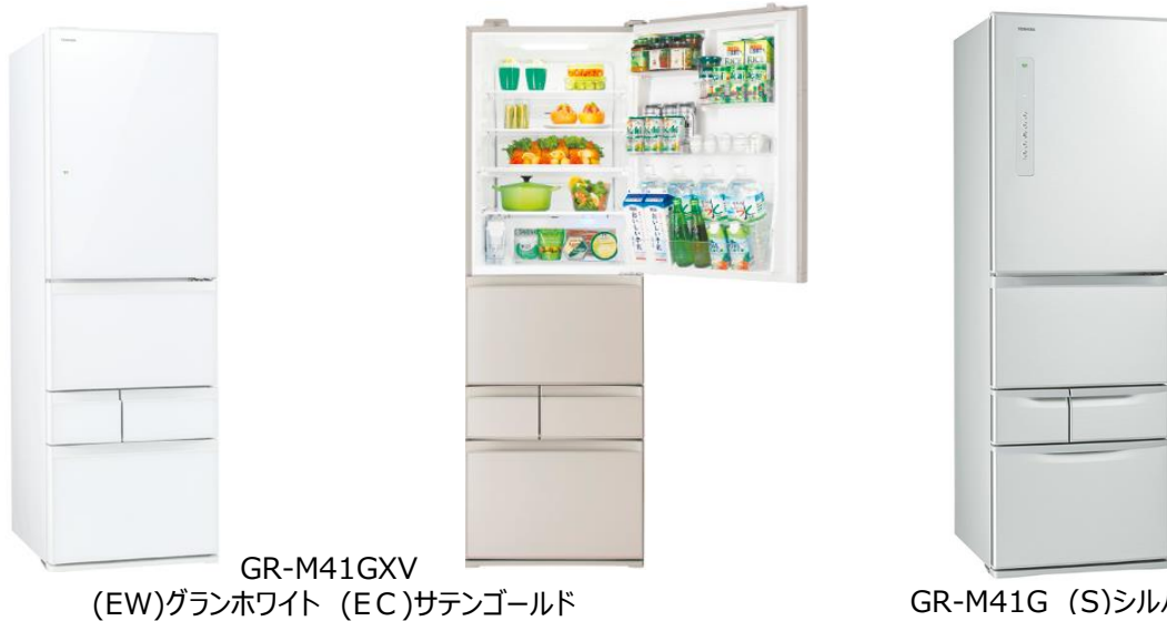
GR-M41GXV (EW)グランホワイト (EC)サテンゴールド

東芝ライフスタイル株式会社は、使用頻度の多い野菜室をまんやかにレイアウトし使いやすさが好評の「VEGETA(ベジータ)」シリーズの新製品として、幅60cmのスリムタイプの5ドア冷凍冷蔵庫GR-M41GXV/GR-M41Gの2機種を2017年11月中旬から発売します。