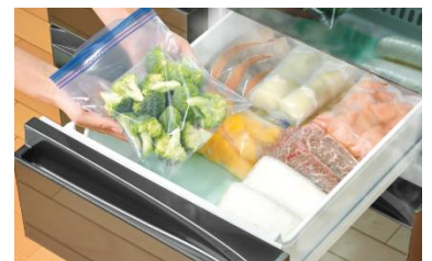
<下ゆで無しに野菜をゆっくり冷凍、調理も時短>

センサーにより24時間自動で効率運転するecoモードを装備。節電機能 注6 やおでかけ機能 注7 といったオプション設定でさらに節電することができます。