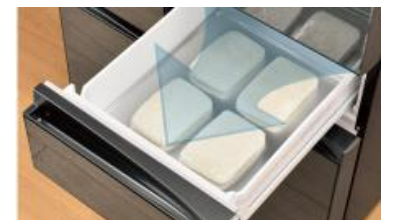
<炊き立てのご飯を一気冷凍し、美味しく保存>