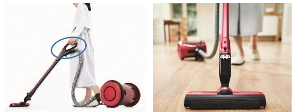
「軽い操作性」イメージ

ちり落としプレート、ブラシ毛のフッ素加工、静電気を抑制するためのAgブラシによって、回転ブラシへのゴミ付着を抑制することで、お手入れも簡単です。様々な床や壁ぎわの細かなゴミをしっかり取り除き、床の菌を約99% 注8 除去します。