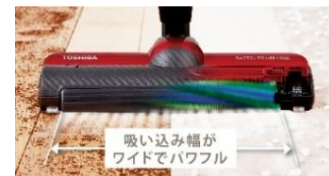
自走式「ラクトルパワーヘッド」イメージ