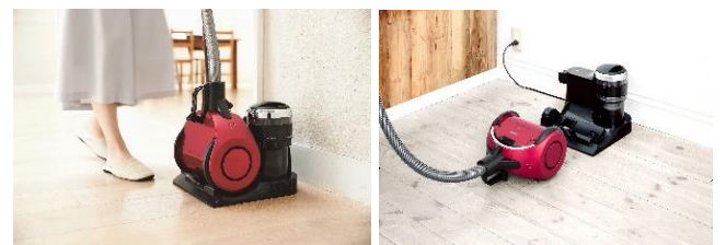
「ダストステーション」イメージ (VC-NXS2のみ)

お掃除終了後、本体と延長管をダストステーションに接続するだけで、毎回本体のゴミ捨てやブリーツフィルターのちり落としを自動 注4 で行う、「お手入れの手間が軽減する」と人気の機能です。ダストステーションには、大容量 注9 のダストカップが搭載されているので、お掃除のたびに毎回ゴミを捨てる必要がありません。