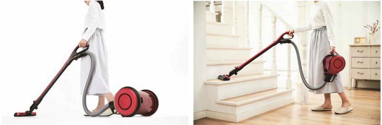
「VC-NXシリーズ」使用シーン イメージ

東芝ライフスタイル株式会社は、強力な吸引力・長い運転時間・軽い操作性を兼ね備えた、当社フラッグシップモデルのキャニスター型コードレスクリーナー『VC-NXシリーズ』のリニューアル機種として、ゴミの有無を検知して吸引力を自動調整する「おまかせモード」の運転時間を向上 注3 させた、VC-NXS2、VC-NX2の2機種を9月中旬より発売します。