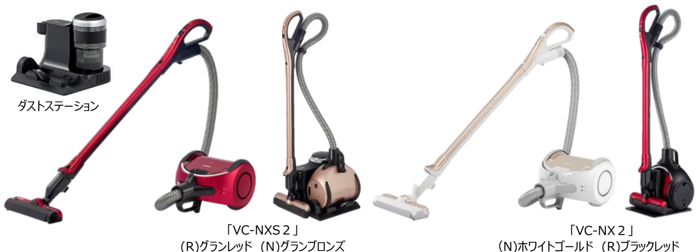
ダストステーション