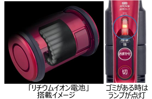
「リチウムイオン電池」 搭載イメージ

当社コードレススティッククリーナー 注5 の2倍にあたる10本のリチウムイオン電池を搭載しており、吸引力をセーブした「標準モード」では最長約60分 注1 の連続運転が可能。また、推奨「おまかせモード」では、「ゴミ残しまセンサー」によってゴミの有無を検知して吸引力を自動で調整するので、充電電池を効率的に使ってお掃除ができる上、制御の見直しによって、従来機種 注3 より約1.5倍の約30～40分 注2 の連続運転が可能になりました。更に、ヘッドを浮かせると約3秒後に一時停止、約60秒後に運転を完全停止 注6 するので、充電電池の無駄な消耗も。1回の充電で長く使用できるので、お掃除の際に充電切れのストレスがありません。