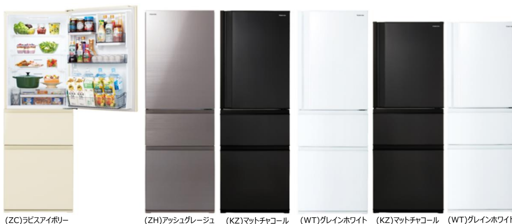
(ZC)ラピスアイボリー

*301～400Lクラス国内家庭用ノンフロン冷凍冷蔵庫において 2020年11月18日現在 当社調べ