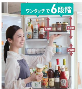
<フリードアポケットの使用(イメージ)>

高さが異なる調味料や飲料等が入るドアポケットは、冷凍冷蔵庫の中でも整理整頓のニーズが高くなっています。そこで、様々な大きさの食品に合わせて、6段階に高さを調節できるスライド式「フリードアポケット」を上段2か所に採用。扉から外さなくても片手で簡単に位置を変えられます。さらに、2段階に調節できる中段ドアポケットを含めると72通りの組み合わせになり、あと少しの高さで物が入らない等の悩みを解決します。また、汚れが気になった際はドアポケットを簡単に取り外してお手入れできるので安心して使用できます。