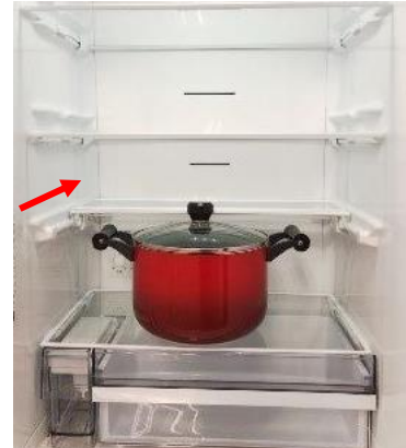
<アクション棚スライド時(イメージ)>