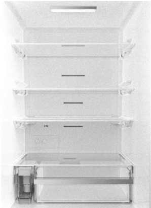
<明るい室内(イメージ)>