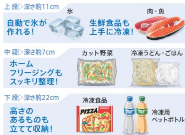
<3段冷凍室収納(イメージ)>