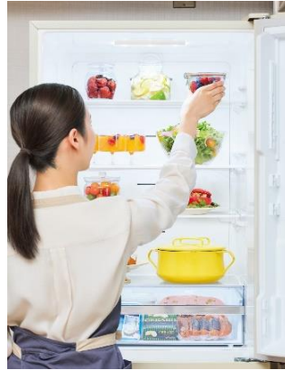
<使いやすい冷蔵室棚(イメージ)>