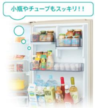
<食品の収納(イメージ)>