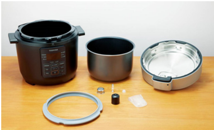
<分解してお手入れ可能>

満水容量は3.0L、調理容量は2.0Lで、約4人分の調理に対応。キャビネットに入りやすいコンパクトサイズです。