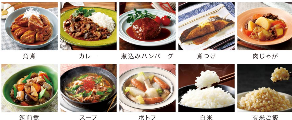
<10種類の自動メニュー>

予約機能を使えば、食材をセットするだけで時間に合わせて自動で調理。予約時間は3時間後～12時間後まで設定可能です。