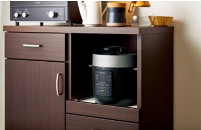
<キャビネット内に収まるコンパクトサイズ>