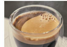
本格エスプレッソ