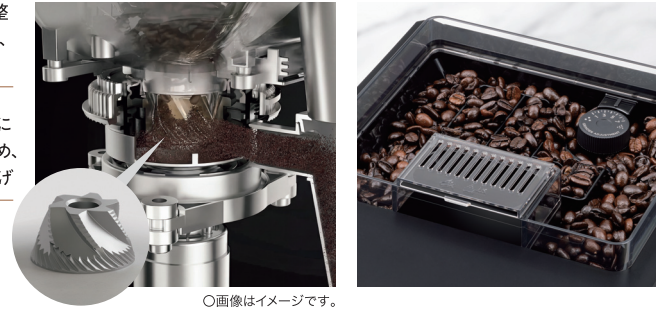
○画像はイメージです。