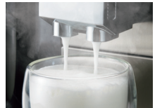
ワンタッチ追いミルク