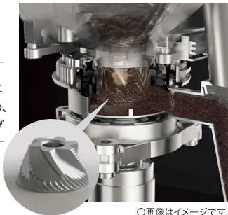
○画像はイメージです。