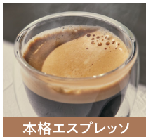
本格エスプレッソ