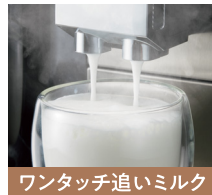
ワンタッチ追いミルク